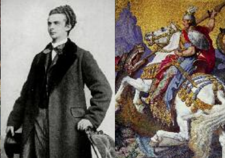
Foto di Ludovico II (a sin.); dipinto murale: »S. Giorgio uccide il drago«, Sala del trono (a destra); cigno in maiolica (in basso)

Nel 1867 una delle più celebri fortezze tedesche, la Wartburg, in Turingia, appena restaurata, si trasformò immediatamente in un modello di riferimento. Per il XIX secolo edificare in forme storiche significava anche »portare a compimento« gli antichi stili, ricorrendo anche alla tecnica moderna e agli studi storici. Da spiccato idealista Ludovico II, come nessun altro nella sua epoca, credeva fermamente nella realizzazione di tale progetto.