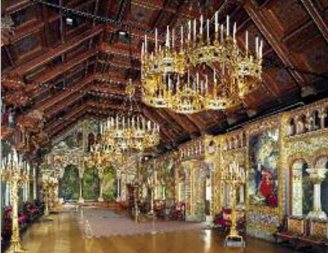
La Sala dei Cantori al quarto piano del Palazzo