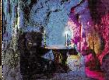
Schlossküche (li. oben), Grotte mit farbiger Beleuchtung (li. unten), Arbeitszimmer (re.), Schmuckkassette (unten)