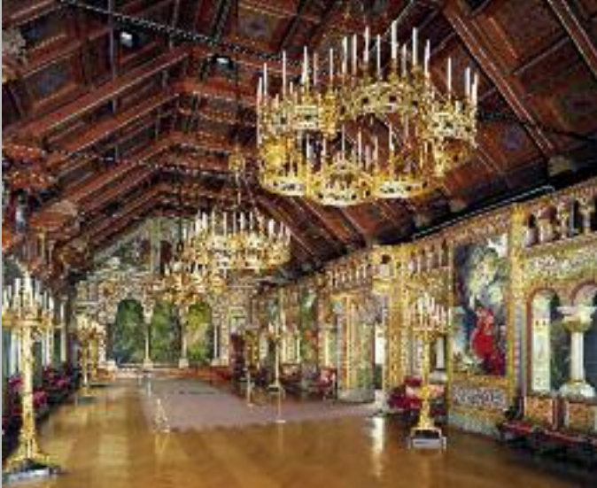
Der Sängersaal im vierten Geschoss des Palas