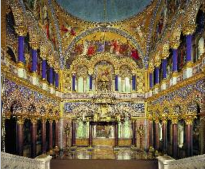
An den Wänden des Thronsaals werden heilig gesprochene Könige und ihre Taten verherrlicht.