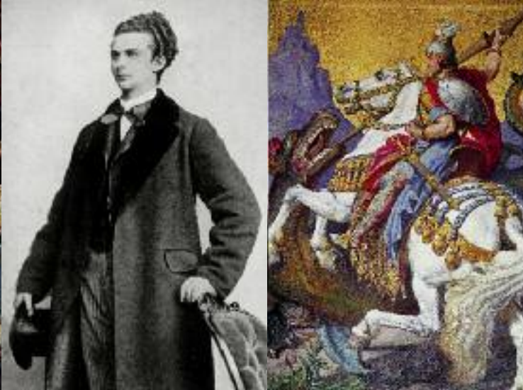
Photo von König Ludwig II. (li.); Wandbild »St. Georg tötet den Drachen« aus dem Thronsaal (re.); Majolika-Schwan (unten)