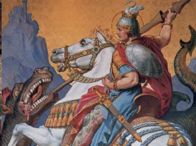
St. Georg tötet den Drachen, Wandbild im Thronsaal, 1886

Innenräume orientiert sich an deutschen Rittersagen und an der musikalischen Ideenwelt Richard Wagners. Der in Anlehnung an die Wartburg bei Eisenach geschaffene Sängersaal ist mit Szenen aus der Parzival-Dichtung und der Gralssage geschmückt. Über zwei Geschosse erstreckt sich der 15 Meter hohe, in Blau und Gold gehaltene Thronsaal, der einer byzantinischen Basilika nachempfunden ist. Er wurde nie benutzt.