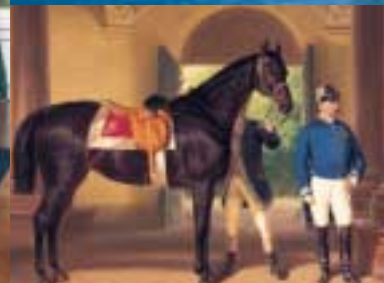
Schloss Nymphenburg (li. o.); Schloss Linderhof (re. o.); Pferdeporträt im Marstallmuseum (li. u.); Maurischer Kiosk in Linderhof

Amoretten präsentierte Krone diente als Laterne, deren Glühbirne von einer versteckt untergebrachten Batterie betrieben wurde. Der magische Glanz der Schlittenbeleuchtung versetzte die Bevölkerung bei den nächtlichen Fahrten des Königs in höchstes Erstaunen.