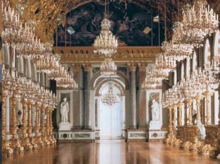
Die Große Spiegelgalerie in Schloss Herrenchiemsee

Zu Ehren Ludwigs XIV. von Frankreich sollte ein bayerisches Versailles entstehen. Als Ludwig II. 1886 starb, war der Bau noch nicht vollendet. Die Kosten für die monumentale Anlage waren aber bereits höher als die Baukosten für Neuschwanstein und Linderhof zusammen. Das Paradeschlafzimmer mit