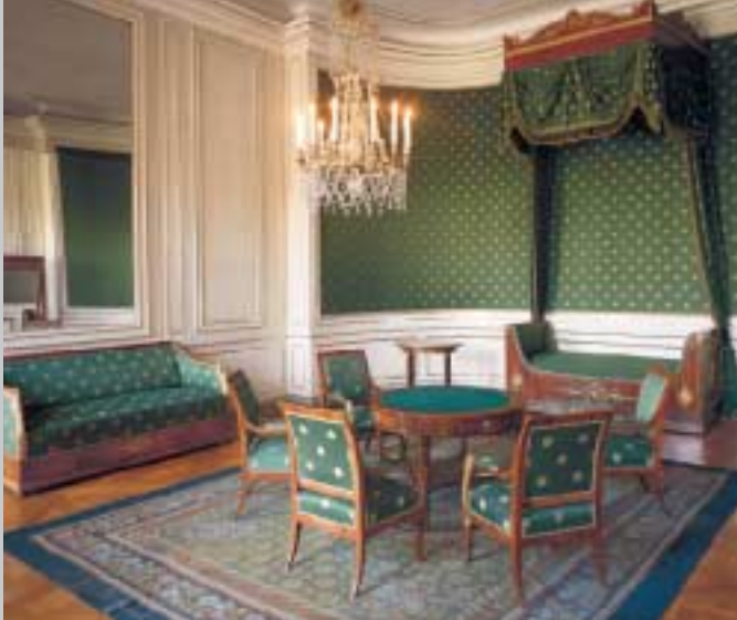
Das Geburtszimmer in Schloss Nymphenburg, in dem König Ludwig II. 1845 das Licht der Welt erblickte