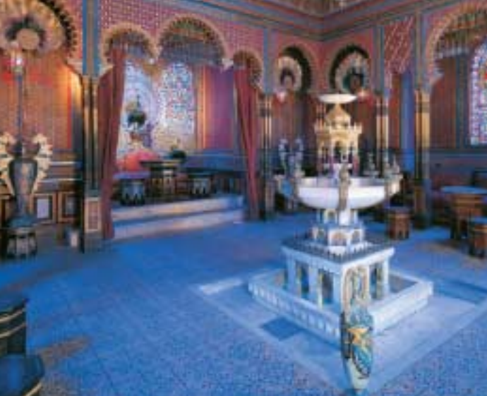
Das Schimmerlicht, das durch bunte Gläser ins Innere des Maurischen Kiosks fällt, erzeugt wundersame Effekte

die alte Königslinde, auf deren Hochsitz der König zuweilen frühstückte, der Maurische Kiosk mit dem Pfautron, das Marokkanische Haus, die Hundinghütte sowie die Einsiedelei des Gurnemanz. Ein »Sesam-öffne-dich-Felsen« führt zur künstlichen Venusgrotte mit Wasserfall und See.