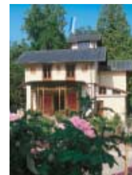
Der Rosengarten vor der Ostseite des Casinos