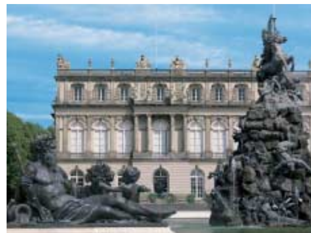
Schloss Herrenchiemsee (Neues Schloss)

seinem 3 x 2,60 Meter großen Bett übertraf an Luxus das französische Vorbild. In der fast 100 Meter langen Spiegelgalerie konnten über 1800 Kerzen angezündet werden. Die königliche Wohnung ist im Vergleich zu diesen beiden Prunkräumen intimer eingerichtet. Umgeben ist das Schloss, dessen streng geometrischer französischer Garten mit den berühmten Wasserspielen nur einen Teil der nie vollendeten Gesamtanlage darstellt, von einem naturnahen Park mit altem Baumbestand. Im modern gestalteten König Ludwig II.-Museum können Exponate besichtigt werden, die dem Leben und Wirken des Königs gewidmet sind.