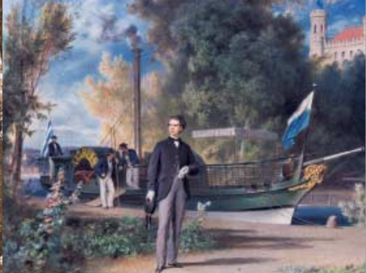
König Ludwig II. landet mit seinem Schiff »Tristan« in Berg, 1867