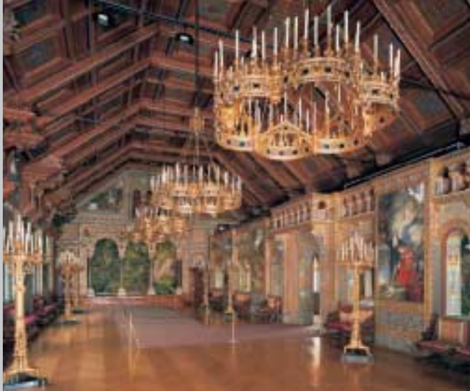
Der Sängersaal von Schloss Neuschwanstein